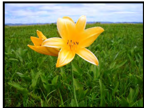
エゾカンゾウはサロベツ湿原の代表種。サロベツ湿原をサロベツ原生花園と呼ぶ人も多い。

しかし、湿原は、泥炭採掘、農耕地転換などにより、世界的に減少の一途を辿っている。さらに、地球温暖化が、泥炭湿原消失の引き金となるとも考えられている。