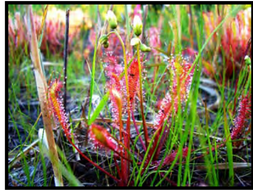
食虫植物として知られるナガバノモウセンゴケ。中央に見える葉は、虫を捕獲している。

泥炭は、日本では園芸用土壌のピートモスとして主に利用されるが、海外では燃料・浴用などにも利用されるため需要が高く、泥炭採掘は、北半球の冷温帯湿原で広く行われている。サロベツ湿原では、1970年から2003年の間に年間3-22 haの面積で深さ3 m以上の泥炭が採掘されていた。現在、採掘は中止され、国立公園に指定され湿原の保護と再生が図られている。