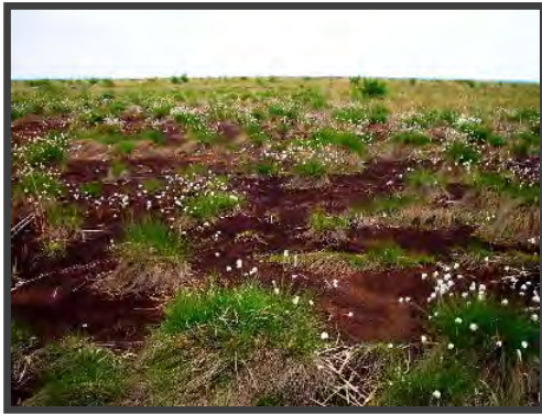
泥炭採掘跡地に見られるワタスゲの谷地坊主。

進することを示していた。このように、リターの蓄積は、様々な形で植生発達に関与している。